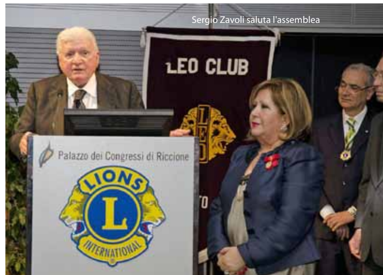
Sergio Zavoli saluta l'assemblea