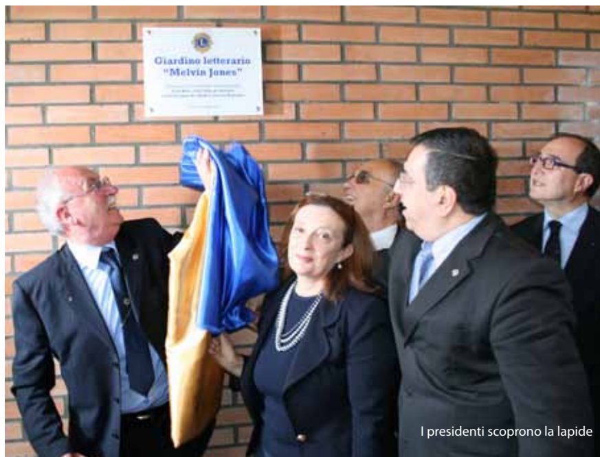
I presidenti scoprono la lapide

Quale miglior luogo poteva rispondere all'impegno assunto dai club service forlivesi di un'area