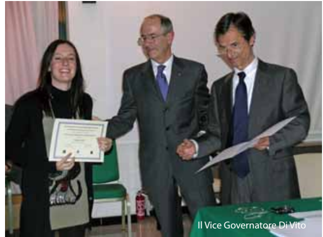
Il Vice Governatore Di Vito

Nel dopoguerra l'Italia era il primo paese turistico al mondo. Oggi è al 5° posto come flussi turistici internazionali e al 3° posto tra i paesi europei, dopo