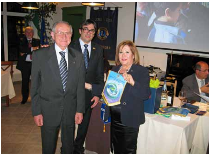
Il Governatore alla Charter