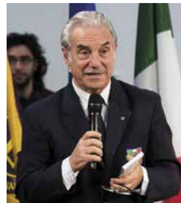
Lions in Italia.

Il 6 Giugno sarà la giornata dedicata al Lions Club International. Arriveranno il Presidente Internazionale e, con lui, governatori e Lions da ogni parte del mondo, come e forse più di una convention. Peraltro, quella di Milano 2015 sarà la prova e l'anteprima di Milano 2019, data - storica - della prima Convention internazionale