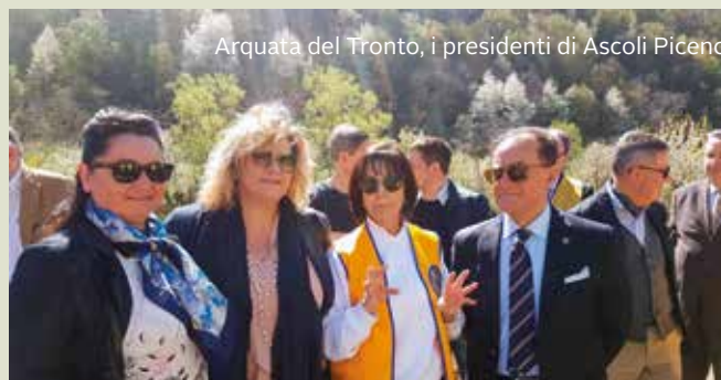
Arquata del Tronto, i presidenti di Ascoli Piceno

Forse una goccia in un mare di necessità, ma esserci per portare la nostra solidarietà, in punta di piedi, cercando di non disturbare le persone (tante) che si oppongono al destino crudele dei borghi distrutti, scippati del loro futuro, scippati dei sogni, scippati di una storia rurale e di una cultura tanto "italiana", dove la fierezza si accoppia all'orgoglio per la propria Vita, dove le opinioni e le passioni spesso si manifestano nel silenzio con il silenzio. Una goccia, ma dalle gocce parte la vita appunto, e noi Lion siamo chiamati ad andare avanti non fermare la nostra spinta, andare oltre il possibile ed osare l'impossibile, essere insomma