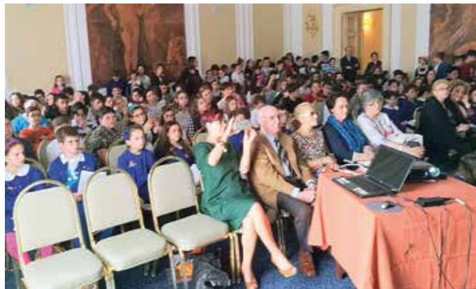
La sala Cascella di Castello Chiola gremita di studenti e autorità

conti”. Il Club ha istituito il Concorso nell'anno sociale 2012-13, in adesione alla Campagna Internazionale di alfabetizzazione, lanciata dall'allora presidente internazionale Waine A. Madden. Per la sua originalità ed efficacia, “Fiabe al Castello” ha ricevuto, in occasione della Convention Internazionale di Amburgo del 2013, l'ambito premio “Programma di azione della lettura”, con la consegna dell'emblema che da allora arricchisce il labaro del Club. Il Concorso si ripete ogni anno, ogni volta con rinnovati entusiasmo e partecipazione. Gli alunni progettano e realizzano collettivamente i testi delle fiabe, sotto la guida dei loro