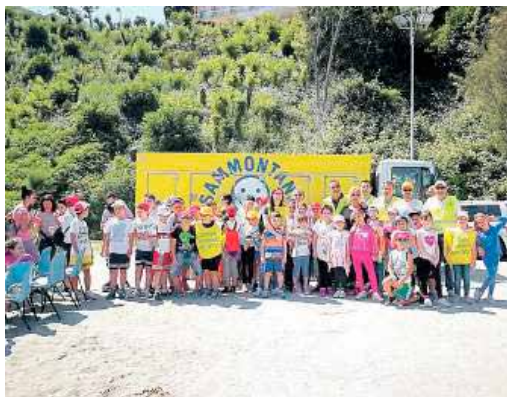
Foto di gruppo per gli studenti di Gabicce

Una campagna concreta contro i rifiuti marini. Promotori il Lions Club di Gabicce Mare e il Comune, con la sponsorizzazione di Conad e Sarmontana. La pulizia ha riguardato contemporaneamente