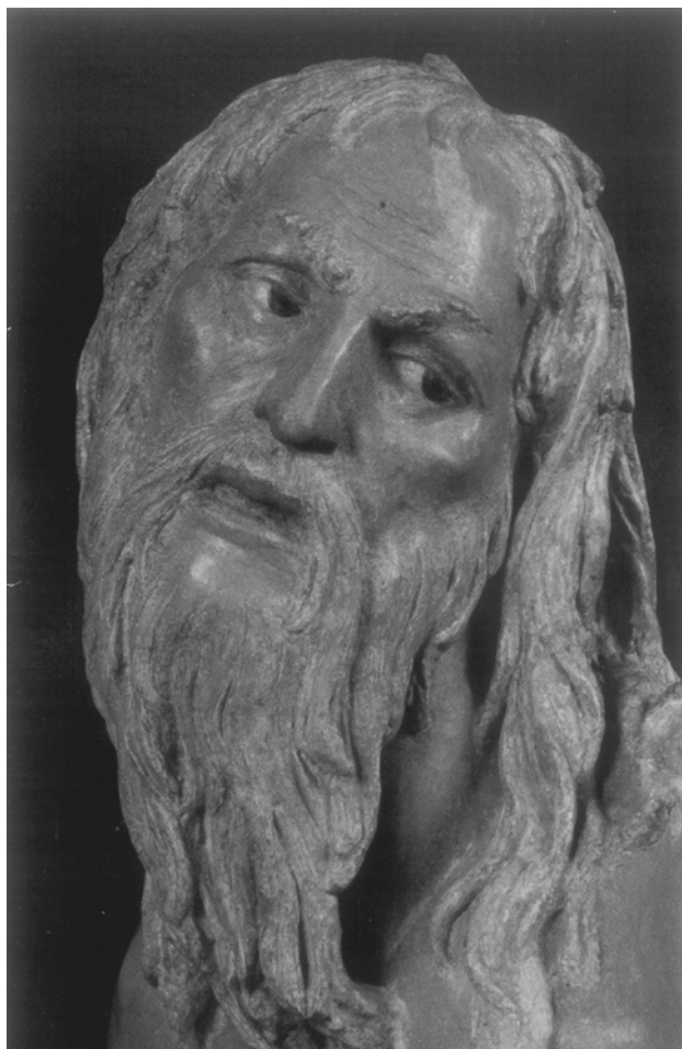
Pinacoteca Comunale Faenza

Via Rambelli, 21 Faenza (RA) Tel. 0546 634444 Fax 0546 636468 www.autointerni.it