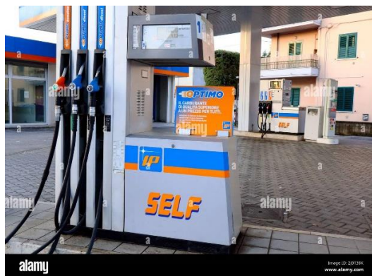
Stazione di servizio IP Via Sarsinate,5 Sant'Agata Feltria