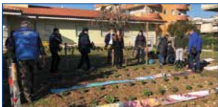
CENTRO «FATTORIA DEL SORRISO» - PESCARA