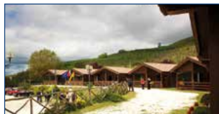
VILLAGGIO LIONS DELLA SOLIDARIETÀ DI CORGNETO

La Fondazione è inoltre editrice della rivista Lions Insieme , organo ufficiale del Distretto 108A, bimensile, pubblicato in forma cartacea ed anche online, accessibile quindi a tutti. Si tratta di un periodico che rende noti, puntualmente, service, eventi ed attività posti in essere sia dai Club, sia dalla Fondazione medesima. Fondazione che, in estrema sintesi, è l'organo giuridico a disposizione del Distretto, al quale, così come ai Club, in opportuna sinergia e nell'assoluta gratuità del suo agire, garantisce la cornice legale e fiscale entro la quale operare.