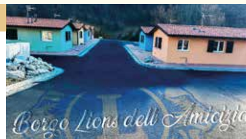
«BORGO LIONS DELL'AMICIZIA» DI ARQUATA DEL TRONTO