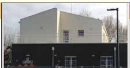
CENTRO DI ACCOGLIENZA DI CERVIA

La Fondazione è inoltre editrice della rivista Lions Insieme , organo ufficiale del Distretto 108A, bimensile, pubblicato in forma cartacea ed anche online, accessibile quindi a tutti. Si tratta di un periodico che rende noti, puntualmente, service, eventi ed attività posti in essere sia dai Club, sia dalla Fondazione medesima. Fondazione che, in estrema sintesi, è l'organo giuridico a disposizione del Distretto, al quale, così come ai Club, in opportuna sinergia e nell'assoluta gratuità del suo agire, garantisce la cornice legale e fiscale entro la quale operare.