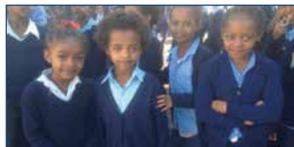
VILLAGGIO SCUOLA DELLA SOLIDARIETÀ A WOLISSO (ETIOPIA)