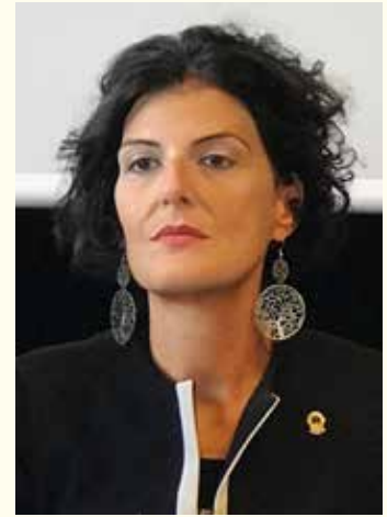
*Presidente Fondazione distrettuale per la Solidarietà