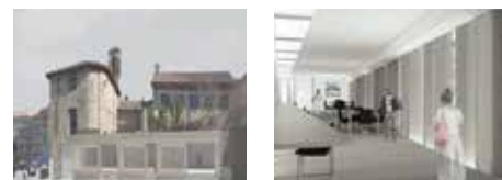
«LIONS STUDENT HALL» - UNIVERSITÀ DI CAMERINO