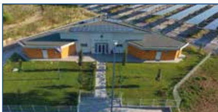
CENTRO DI ACCOGLIENZA «CASA TABANELLI» - PESARO

Il Distretto Lions 108A è composto dai 93 Lions Clubs esistenti nelle regioni: ROMAGNA, MARCHE, ABRUZZO, MOLISE