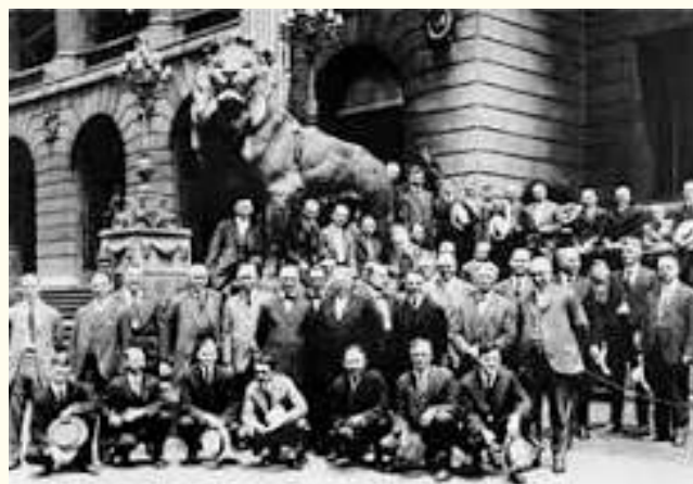
1917 - I Soci Fondatori del Lions Club International

Oggi, il Lions Club Italia conta migliaia di soci e continua a essere attivo in moltissimi settori: dalla lotta al diabete all'ambiente, dall'educazione giovanile ai progetti per la pace. Il suo spirito originario, però, resta immutato: "Dove c'è un bisogno, lì c'è un Lions".