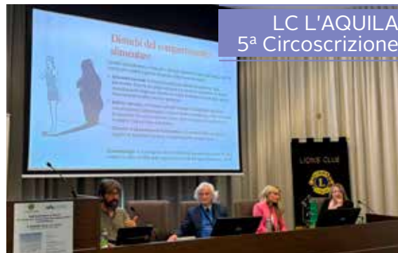
LC L'AQUILA 5 a Circoscrizione

Dalle riflessioni emerse, è apparso chiaro che la gentilezza è una scelta consapevole, non un automatismo. Significa considerare l'effetto delle nostre parole e azioni sugli altri, riconoscere la comune umanità e il desiderio universale di essere ascoltati e