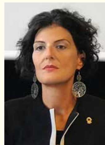
*Presidente Fondazione distrettuale per la Solidarietà